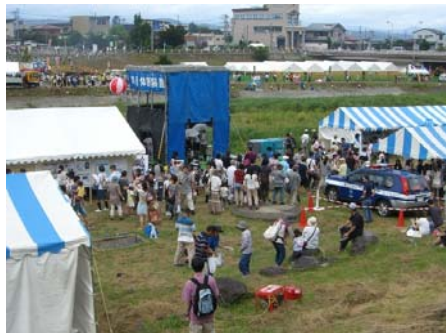
日本一の芋煮会大鍋ゾーンの対岸に設置。仮設橋を渡り来場。