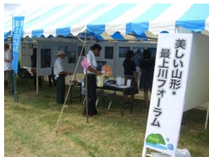
「身近な水辺と人々のいとなみ」がテーマの水辺の四季写真コンテスト作品を展示。山形県の心安らぐ美しい風景をご覧いただけます。