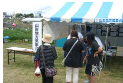
雨量計や気象に関するパネルを展示