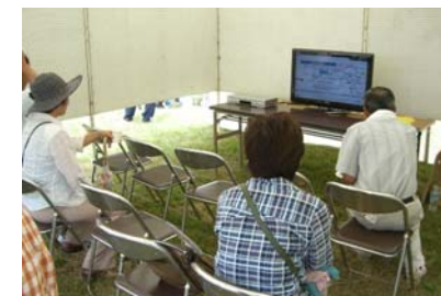
震災・洪水等のビデオを上映