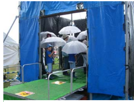
時間雨量200mm/hが体験できる降雨体験装置