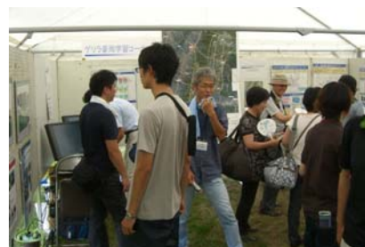
震災・水防・河川事業等のパネルを展示