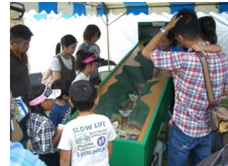
土石流の仕組みが分かる模型実演