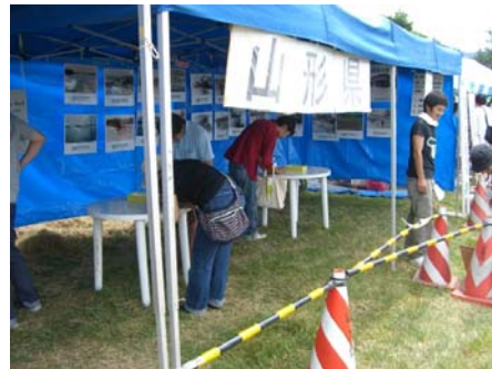
①河川や砂防等に関するパネルを展示 ②山形の魚PRとして、豊かな海づくりのために、県で行っている栽培漁業のPR