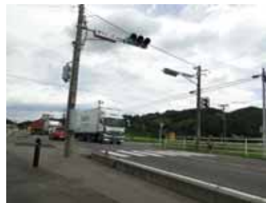
白石市越河五賀字宮下前下町地内 (県道越河・角田線交差点)