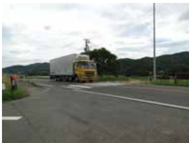
白石市越河字町屋敷地内 (越河郵便局北側)