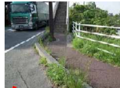
白石市齋川字地藏院館地内 (齋川歩道橋上り線)