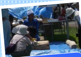
丸太切りコーナー