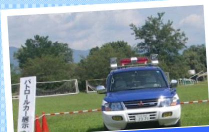
パトロールカー展示