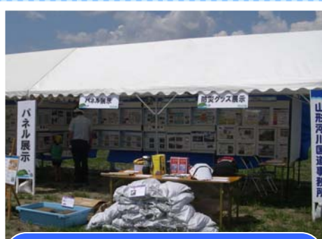
パネル・防災グッズ展示