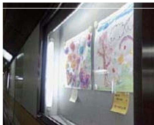
▲過去の掲示の様子