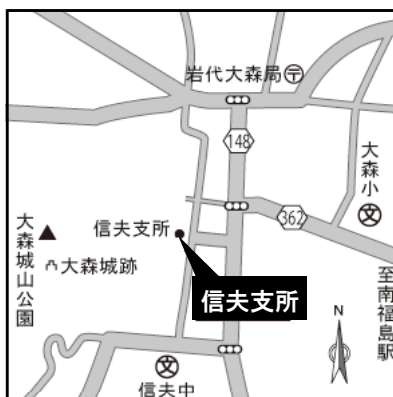
▲福島市信夫支所 （第1回～第4回説明会会場）