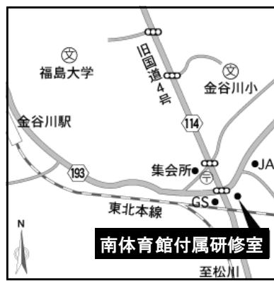
▲福島市南体育館付属研修室 （第5回説明会会場）