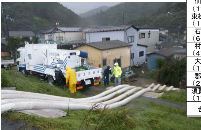
石巻市 横川地区排水状況