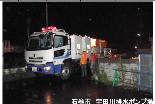
石巻市 宇田川排水ポンプ場