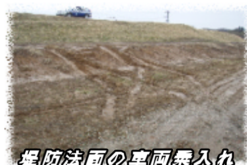
堤防法面の車両乗入れ