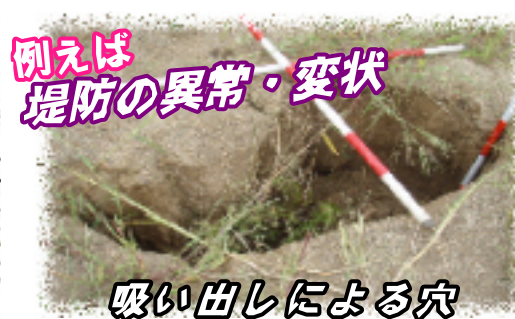
吸い出しによる穴