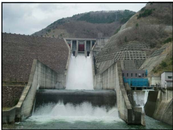
堤体下流からの様子

なお、降雨や気温上昇により下流河川の水位が上昇する事がありますので注意してください。