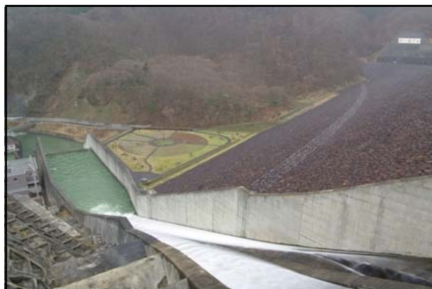
堤体上部からの様子