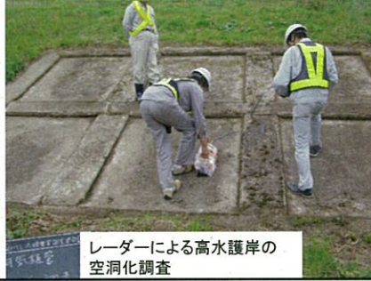
レーダーによる高水護岸の 空洞化調査