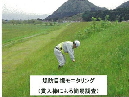
堤防目視モニタリング (貫入棒による簡易調査)