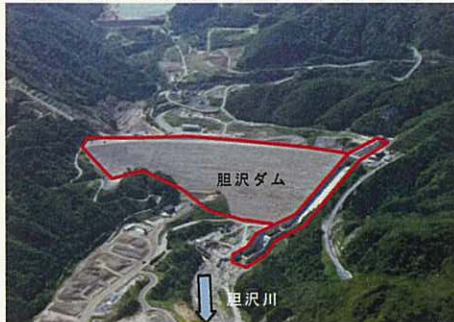
（赤枠はダム堤体の縁取り、平成22年9月撮影）