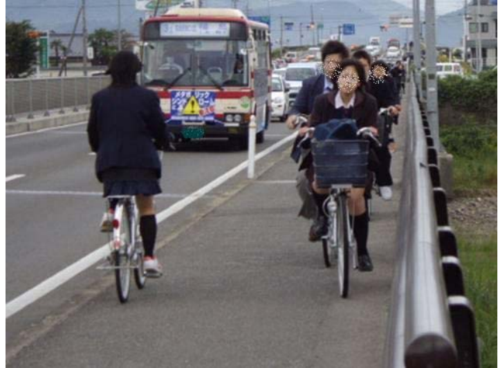
▲整備前の交通状況