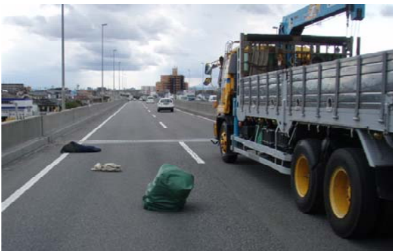
▲落下物： 国道4号で走行車線をふさいでいる布団袋