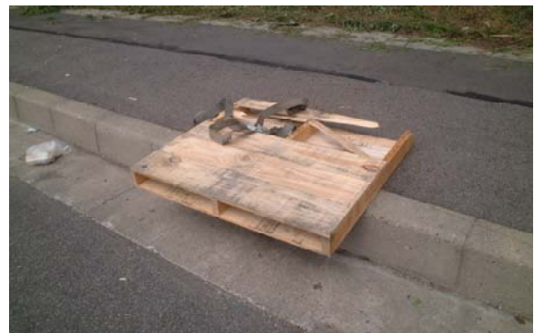
▲落下物： 国道49号に落ちていた積荷を置く木製の台座