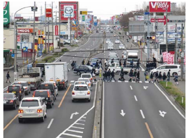
岩沼市方面から仙台市方面を望む