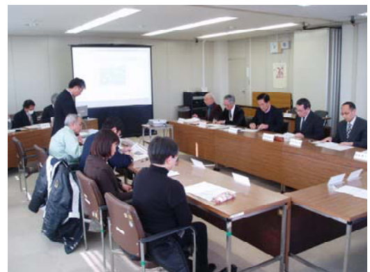
第2回検討会の開催状況