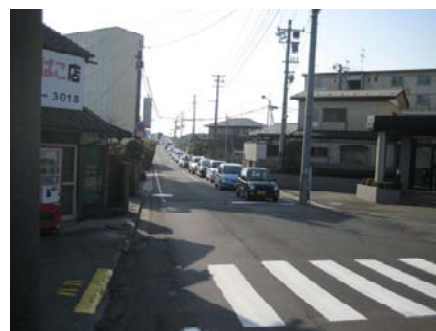
市道藤浪線(亶理方向を望む)