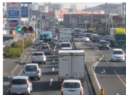
国道4号(仙台方向を望む)