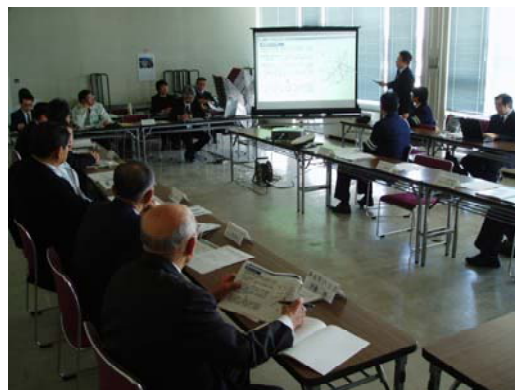
【懇談会】意見交換の様子