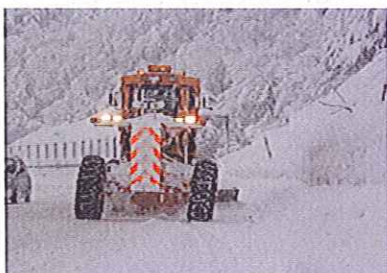
▲直轄国道の除雪状況