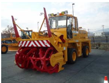
【ロータリー除雪車】