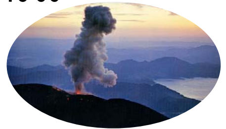
1970年噴火時の様子(噴火口は女岳山頂)