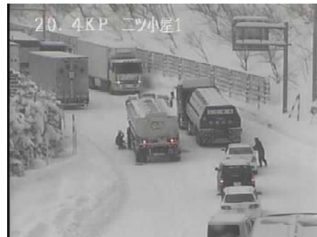
H21及びH22年度の栗子峠における車両のスタック状況