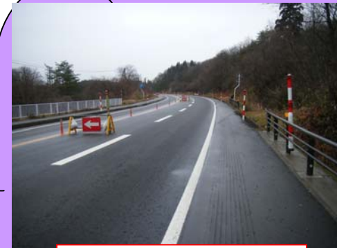
雪が降る前の封鎖状況