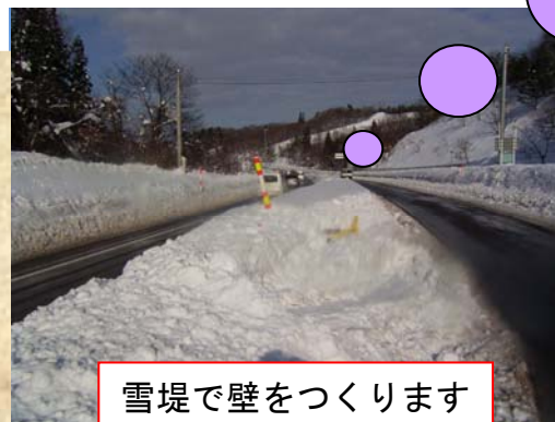
雪堤で壁をつくります