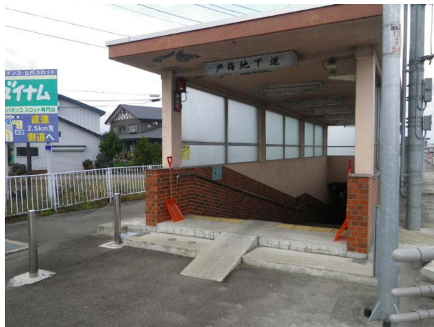
戸蔭地下道設置写真 (大仙市戸蔭)