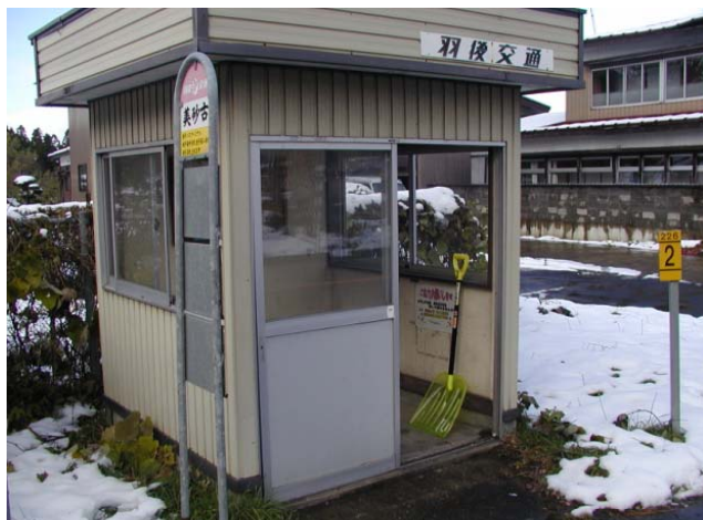
美砂古バス停設置写真 (横手市大屋新町)