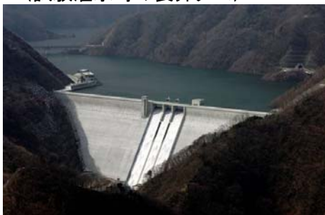
(試験湛水時の長井ダム)