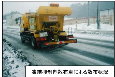
凍結抑制剤散布車による散布状況

※積もった雪が路面に残っていたり、路面が凍結している時間が長くなる場合がありますので、注意して走行して下さい。