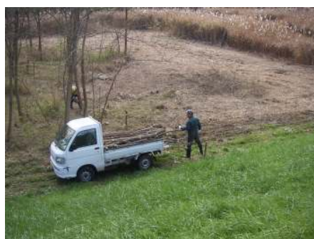
写真-2 伐採木運搬状況