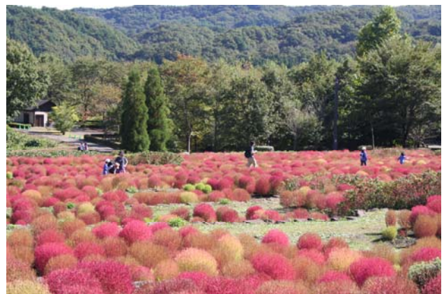
昨年のコキア紅葉の様子(2010/10/10撮影)

※エリアによっては、徐々に紅葉が進んできました。 ※10月上旬～中旬頃にかけて右写真のような予定