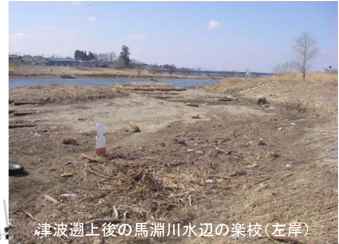
津波遡上後の馬淵川水辺の楽校(左岸)