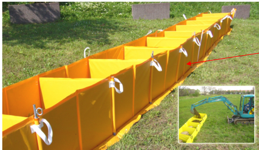
連続遮水壁 HPより引用