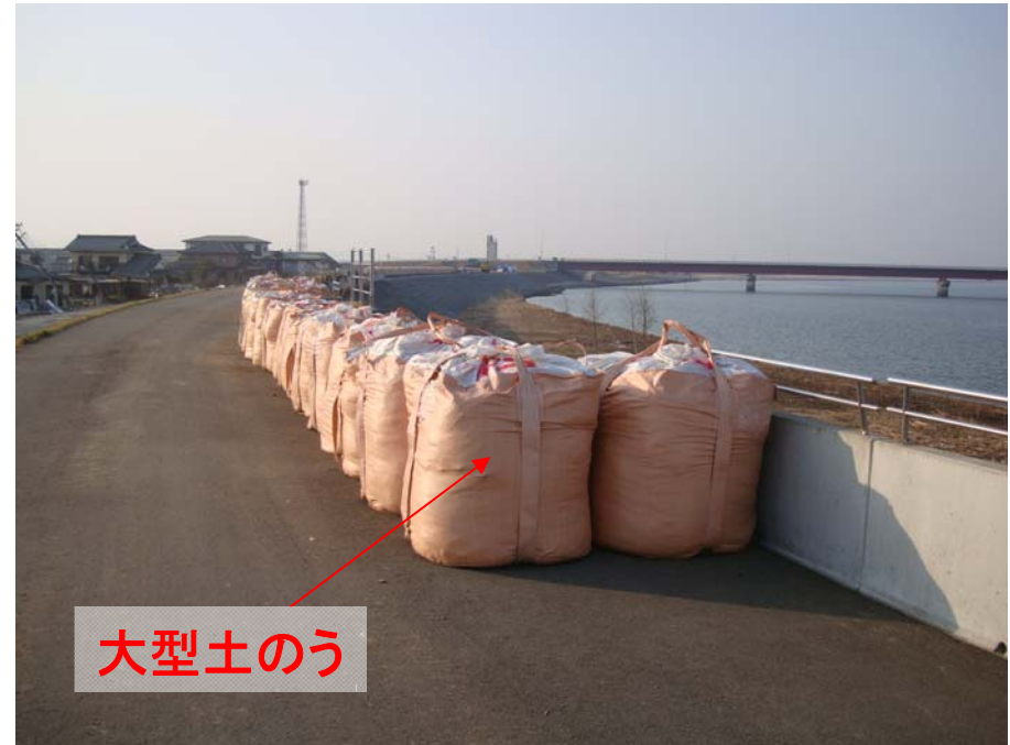
阿武隈川下流右岸河口より1.2k付近