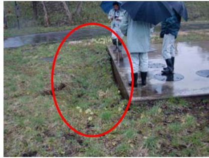
横峰地区：釣り公園 浄化槽脇に生じた段差 (占有者により5/2までに埋戻予定)