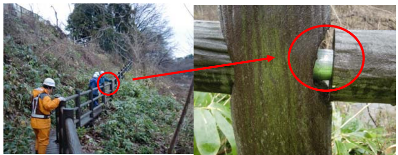
松園散策路：散策路脇の間伐材を使用した転落防止策に腐食等がある事から、4/25までに 応急処置の予定