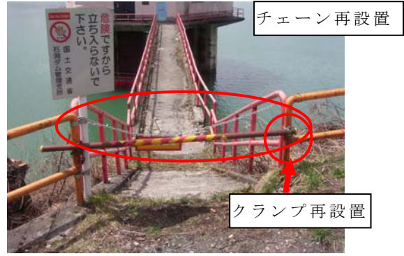
石淵ダムダムサイト：取水塔入り口の立入り禁止箇所へのチェーン等立入り禁止再設置