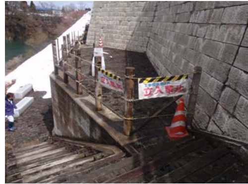
湯本湖岸公園：積雪の影響により破損した支柱立入り禁止措置の再設置