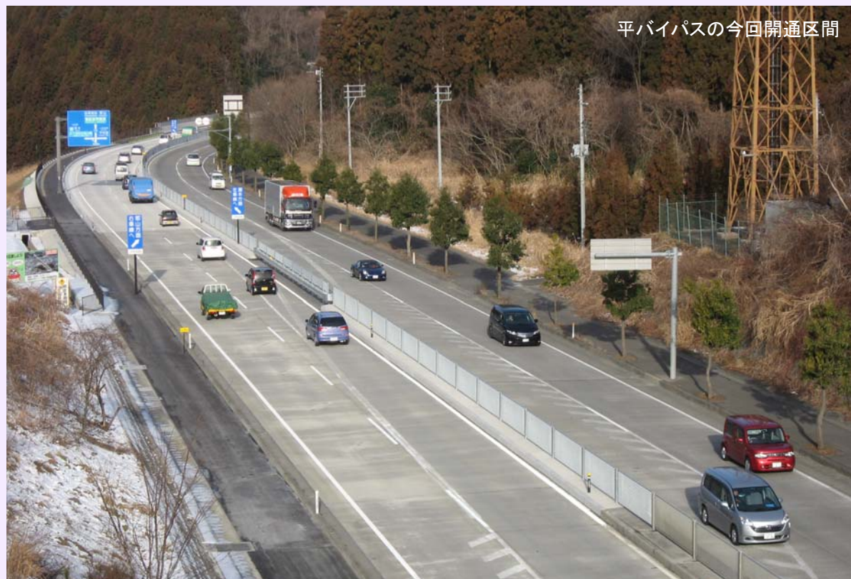
【4車線化前の常磐バイパス状況】