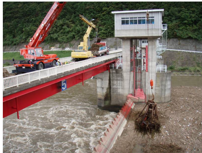
流木回収作業状況