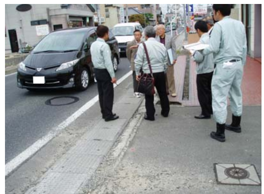
【現地点検】民地との境界の段差

側溝や民地との境界に段差がある。 国道の境界杭の頭が出過ぎている。 電柱や信号柱が歩行空間を阻害している。 歩車道境界ブロックの幅を半分にして歩行空間を広げて欲しい。 等