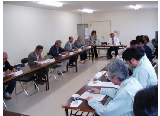
【懇談会】意見交換の様子