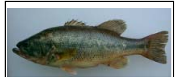
オオクチバス Micropterus salmoides 止水域を好む。主に全国の湖沼やダム湖から確認が報告されており、近年は河川でも増加している。