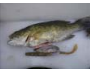
コクチバスの消化管から出てきたアユと釣り餌(鎌田大橋H22.8)