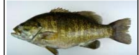
コクチバス Micropterus dolomieu オオクチバスよりも水温の低いところを好み、流れのあるところにも生息する。近年急速に河川への分布を広げており、既に阿賀野川水系、利根川水系でも報告(国勢調査)されている。