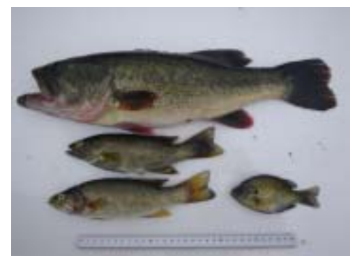
捕獲されたブラックバス類(鎌田大橋H22.8)

福島河川国道事務所では、これらの調査結果を重く受け止め、平成17年度から「外来魚生息実態調査」を実施しています。 その結果、成魚だけでなく、幼稚魚も多く確認され、阿武隈川の各所に定着し、再生産を行っていることが把握されました。 生まれた幼稚魚は初夏から盛夏期にかけて河川内に広く分散し、流れの速いところまで勢力を拡大しています。 特に確認個体数が多かった福島市周辺は、天然アユが遡上・摂餌をする範囲とも重複することから、アユ資源や遊漁への影響も懸念されます。 また平成20年度以降、信夫ダムや蓬萊ダムを中心に、同じく特定外来生物に指定されているチャネルキャットフィッシュが数多く確認され、今後の増加拡大が懸念されます。(H20:12個体 H21:27個体 H22:66個体)