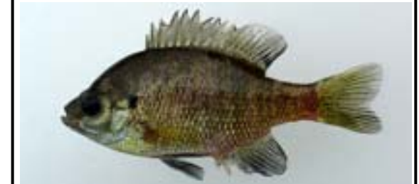
ブルーギル Lepomis macrochirus 湖沼や河川の岸際の流れの緩やかな水草帯を好む。主に全国の湖沼やため池などから報告されている。

ブラックバス類は、平成2年に伊達崎付近で始めて確認(国勢調査)されて以降、5年間でほぼ全域に出現し、その後も増加を続けています。特に平成11年から16年にかけては、コクチバスが著しい増加傾向を示しており、在来魚への影響が懸念されます。