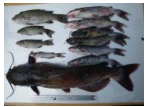
捕獲されたコクチバスとチャネルキャットフィッシュ(信夫ダムH22.8)