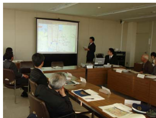
第1回検討会の開催状況