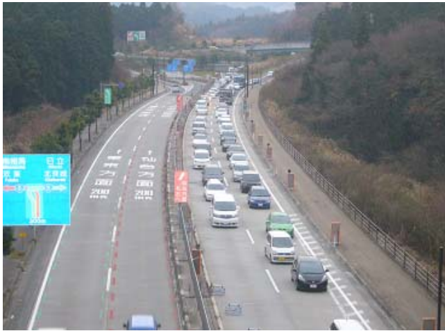
起点側(東京方面)の渋滞状況