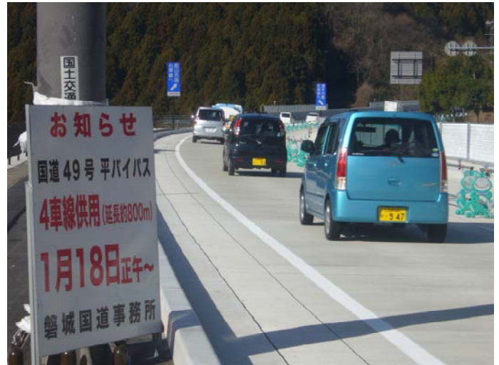
(下り線側：郡山方面)