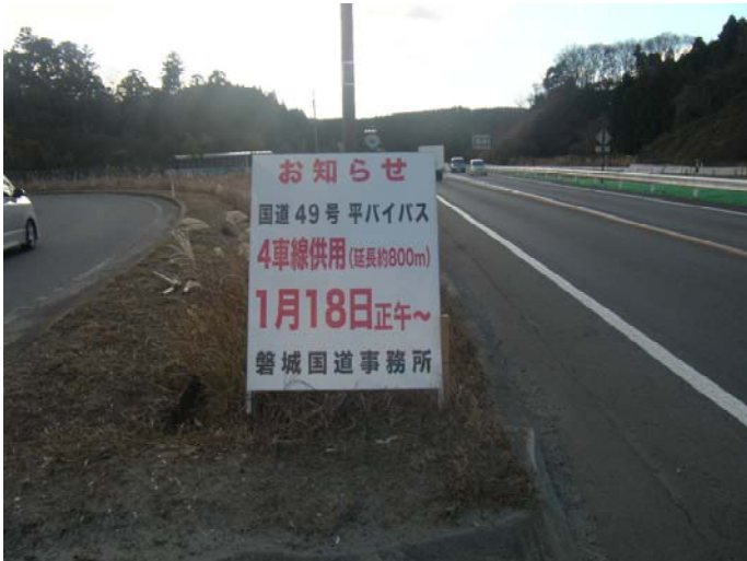
(上り線側：東京方面)