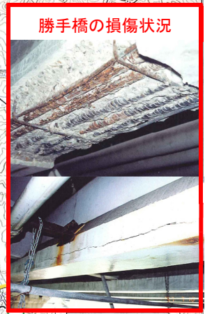
勝手橋の損傷状況