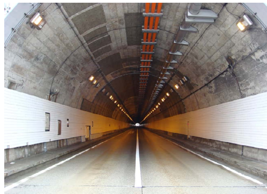
国道112号 湯殿山トンネル