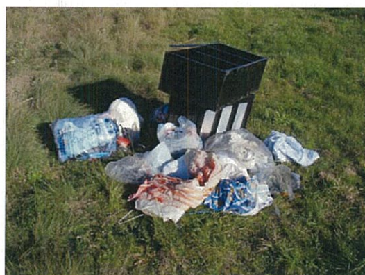
衣類等の家庭用品