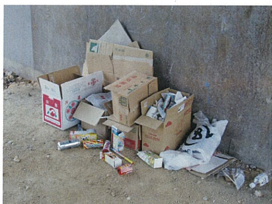
一般ゴミ(花火など)