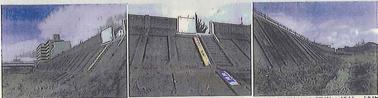
まちに安全にアクセスできる階段・スロープの整備