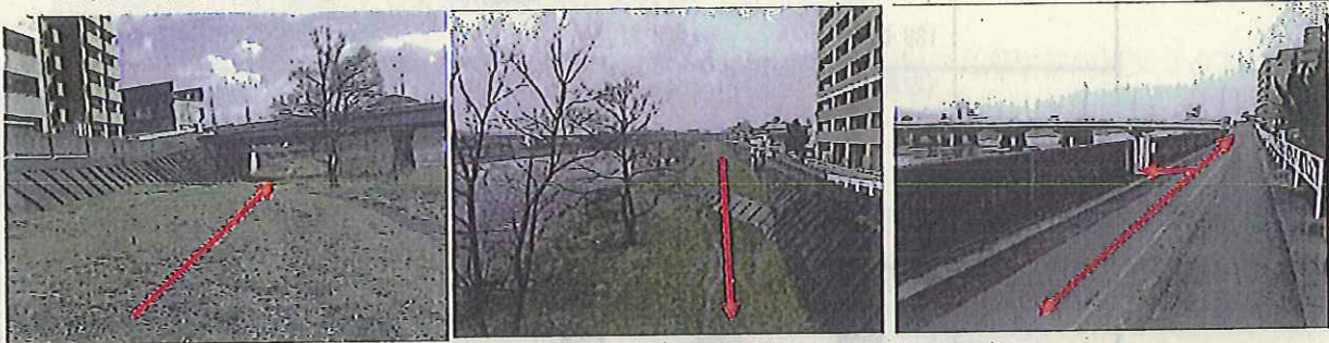
明治橋上下流の連続性、鉾屋町を結ぶ歩行環境の形成