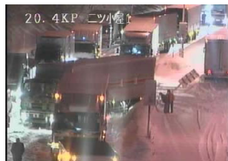
昨年の栗子峠における車両のスタック状況