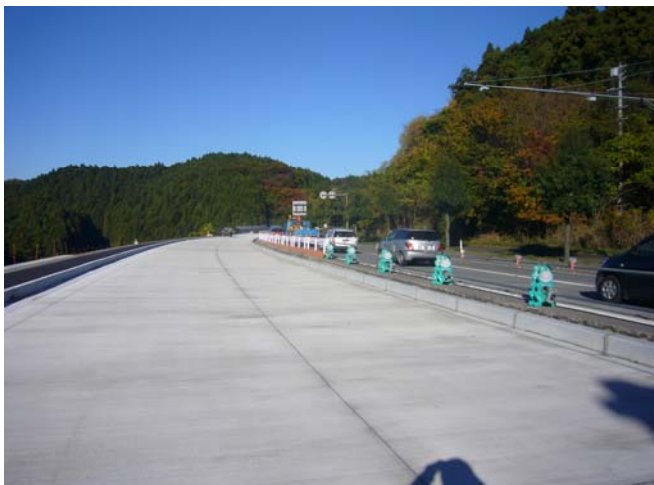
起点側(東京方面)の進捗状況