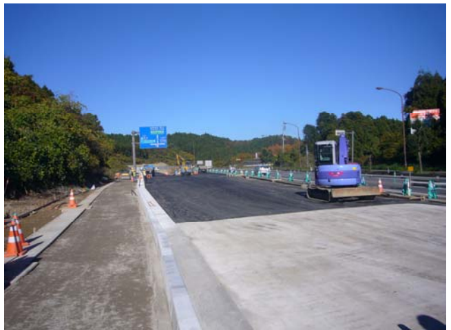
草木ランプ周辺の進捗状況