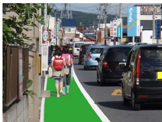
<車道の幅を片側約 50cm 程度狭めて、歩行者の通行帯を設置(緑色のカラー舗装)>