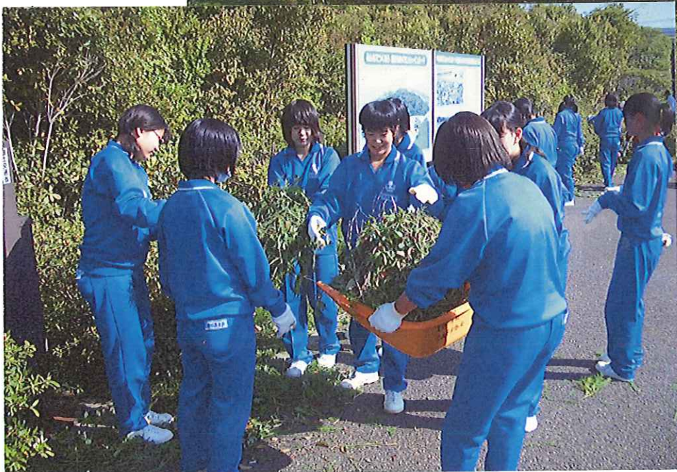
◀ 春の清掃活動状況