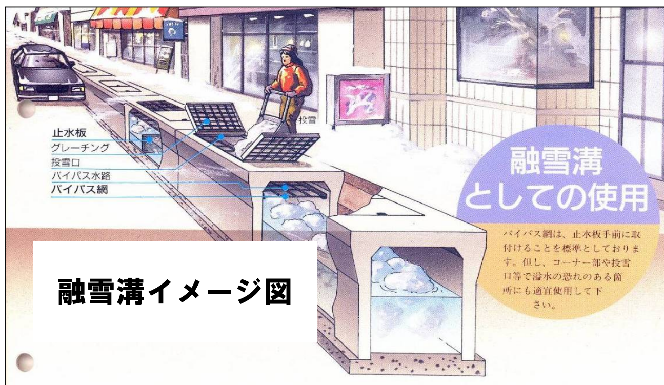
融雪溝イメージ図