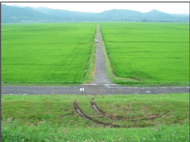
堤外 -1(天端から堤外)