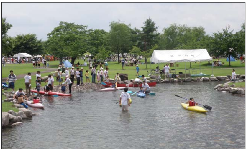
5つ星の評価を得た河川空間：雄物川河川公園