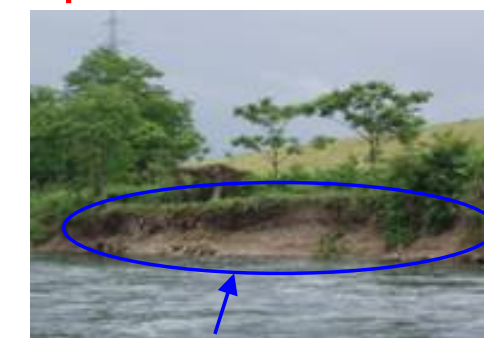
昨年の船上点検により発見された河岸の浸食

翔鷹大橋～阿仁川合流点までは、本来、鷹巣出張所の管理区間ですが、船着き場の都合により、16日ニツ井出張所管内として点検します