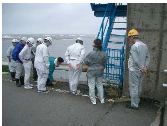
昨年度の点検状況（H21.6.23ニッ井出張所管内）

点検の結果、異常箇所が確認された場合には、その是正についての指導、助言を施設管理者に行い、改善を進めます。