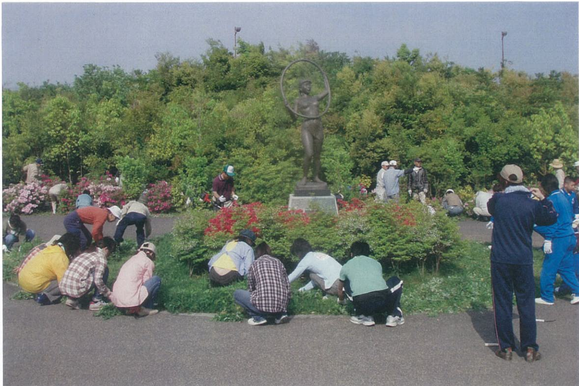
▲ 昨年の清掃活動状況