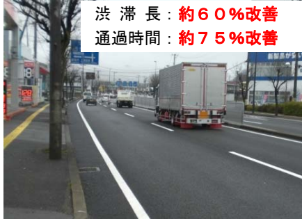
ピーク時間帯(7時~9時)における交通量調査結果より