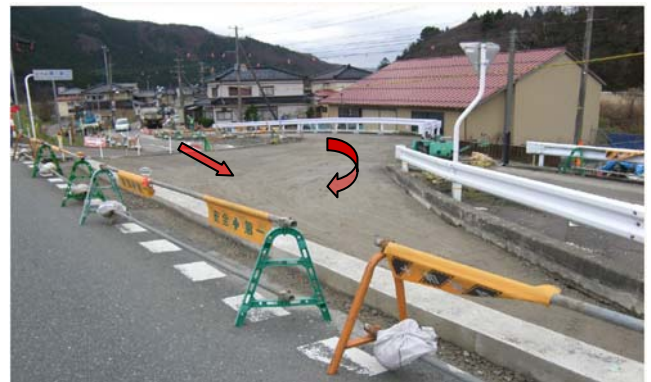
工事状況写真(平成20年12月7日撮影)