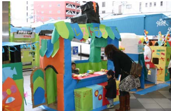
段ボールのお店で遊ぶ子供たち