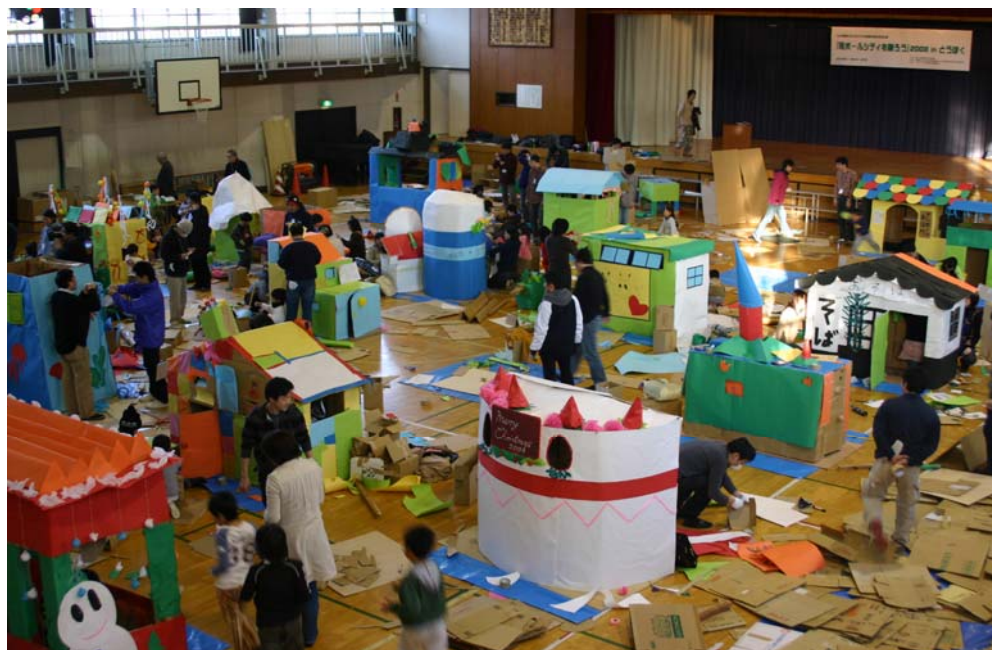
段ボールハウス制作中