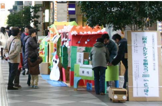
クイズラリー受付中