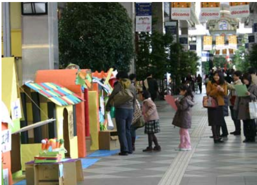
まちなみと段ボールシティ