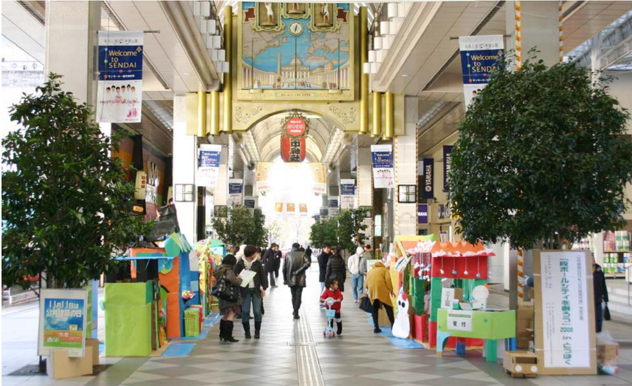
アーケードへの公開展示