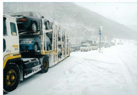
栗子峠のスタック状況